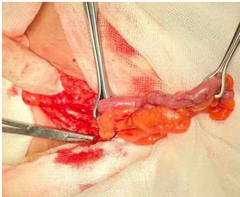
Figura 2. cordón espermático (lado izquierdo) y apéndice cecal (lado derecho)