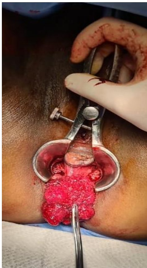
FIGURA 2. RESECCIÓN QUIRÚRGICA DE PÓLIPO RECTAL