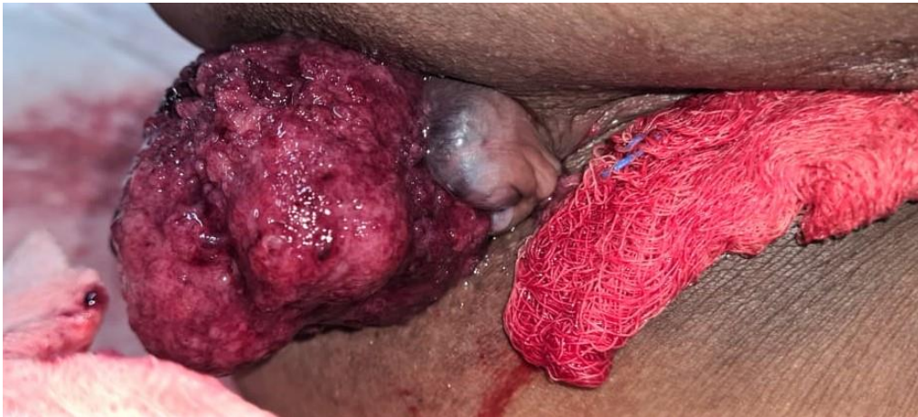
FIGURA 1. PÓLIPO RECTAL PROLAPSADO