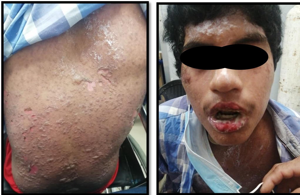
Imagen 1-2. Lesiones con tendencia a coalescer y signo de Nyckolsky positivo