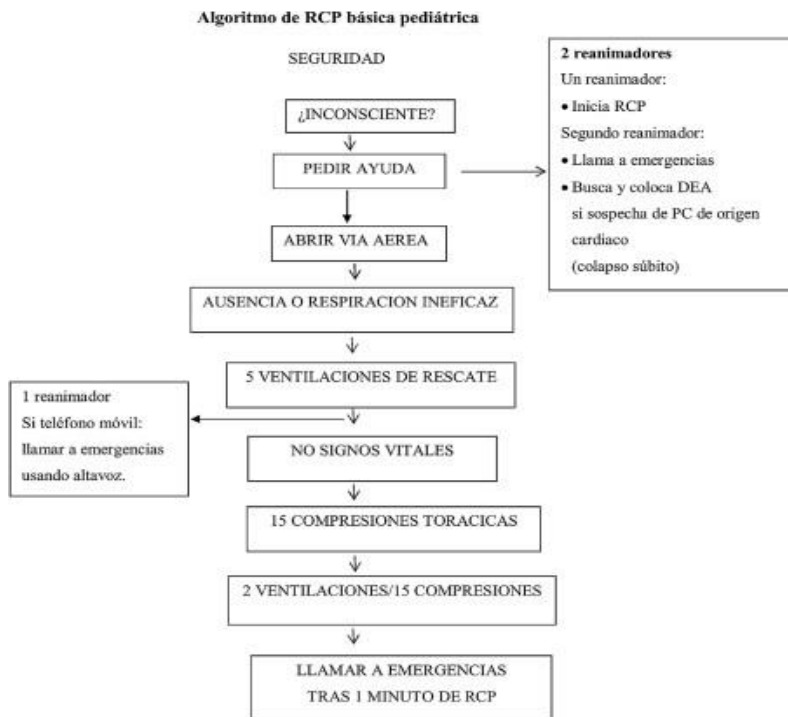
Figura 3 5 :