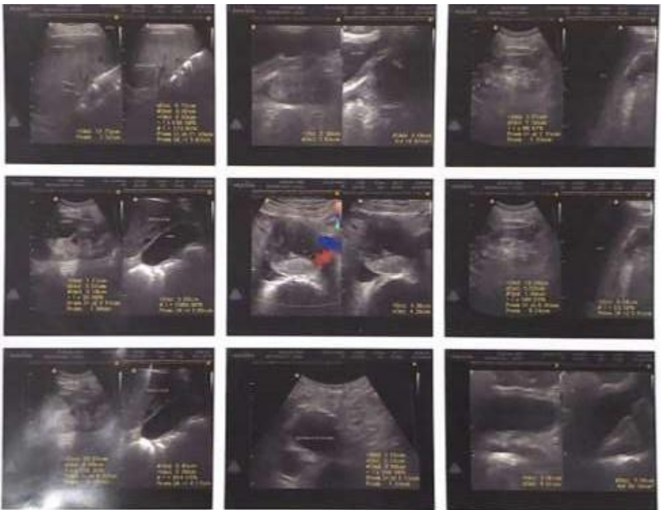
Imagen 1. Ecografía Abdomino-Pélvica.