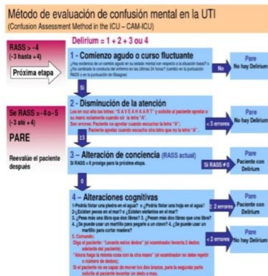
Figura X6, CAM-ICU de google