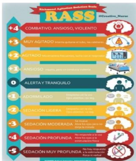
Figura X4, Escala de RASS