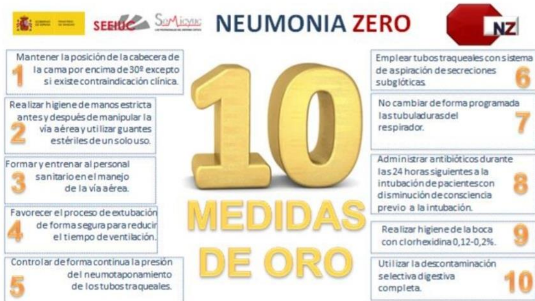
Figura X1, Medidas obligatorias del pNZ de Anexos y Documentos de apoyo. Neumonía Zero Versión 1.4. Marzo 2022