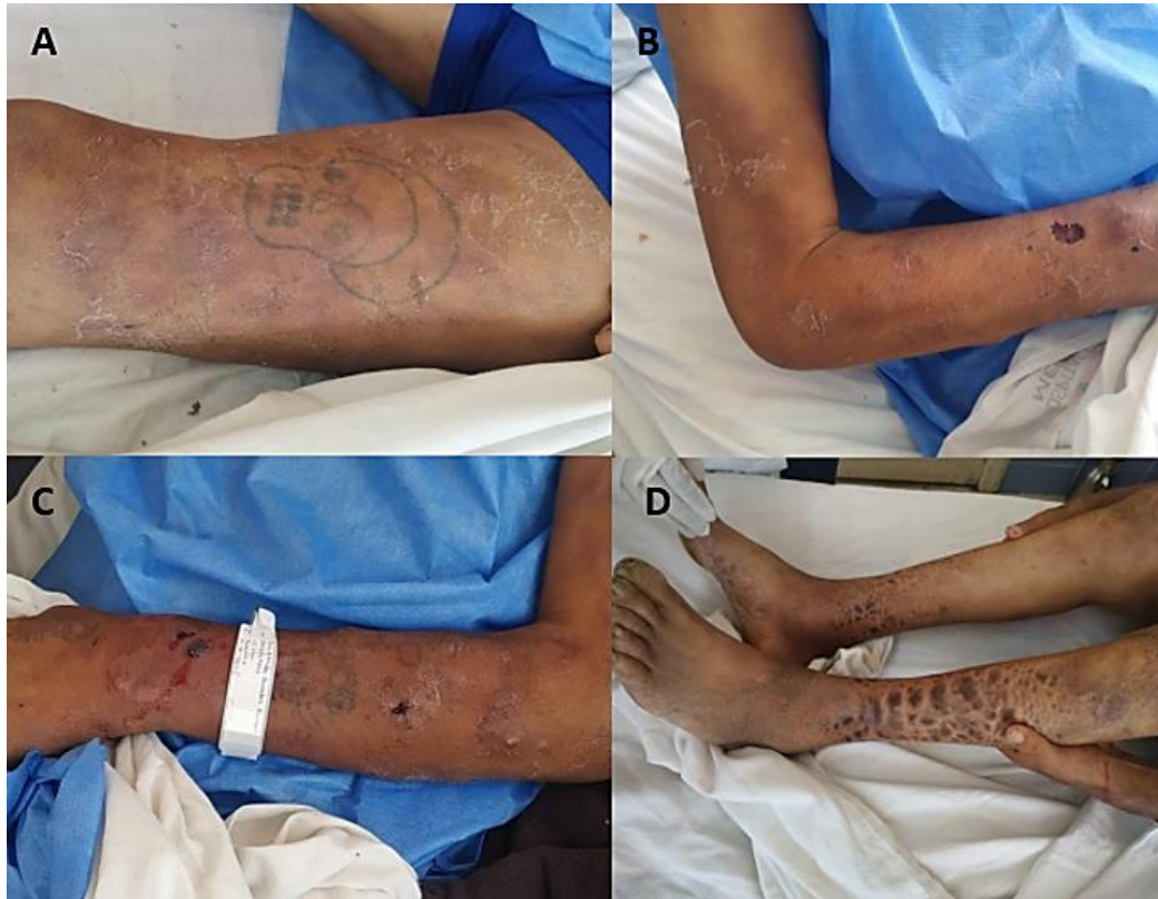
Figura 1. Lesiones nodulares eritematosas anestésicas con descamación y pérdida de anexos cutáneos.