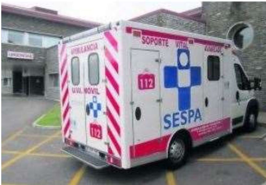
Imagen XVI: UVI Móvil medicalizada aparcada en espera frente a la entrada de urgencias del Hospital de Jarrío.