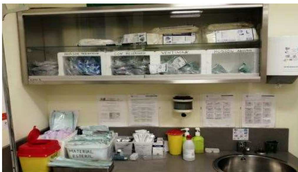
Imagen VI: Vitrina de oxigenoterapia y aerosolterapia.