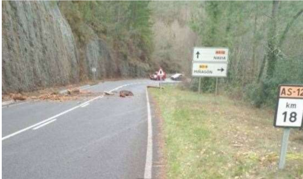
Imagen XIV: Desprendimientos de rocas sobre la carretera AS-12 Grandas de Salime a Navia. Frecuentes en el periodo de octubre a Abril en caso de lluvias. A veces han llegado a cortar la carretera por varios días. Suponen un peligro y riesgo de accidenta sobre todo durante la noche.