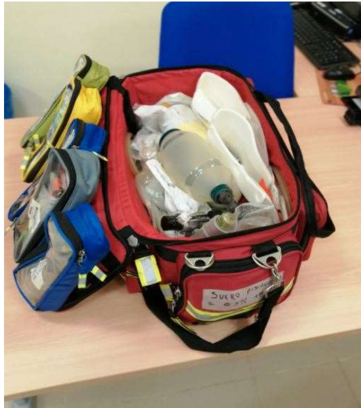
Imagen XII: Interior del maletín de emergencias rojo.