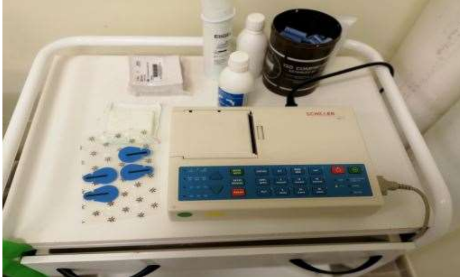
Imagen II: Electrocardiograma de 12 derivaciones.