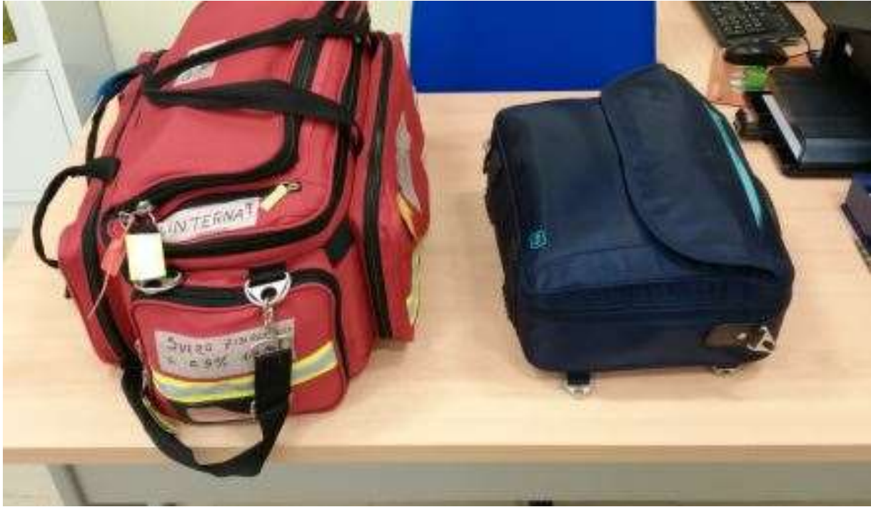
Imagen IX: Maletines de emergencia rojo y azul.