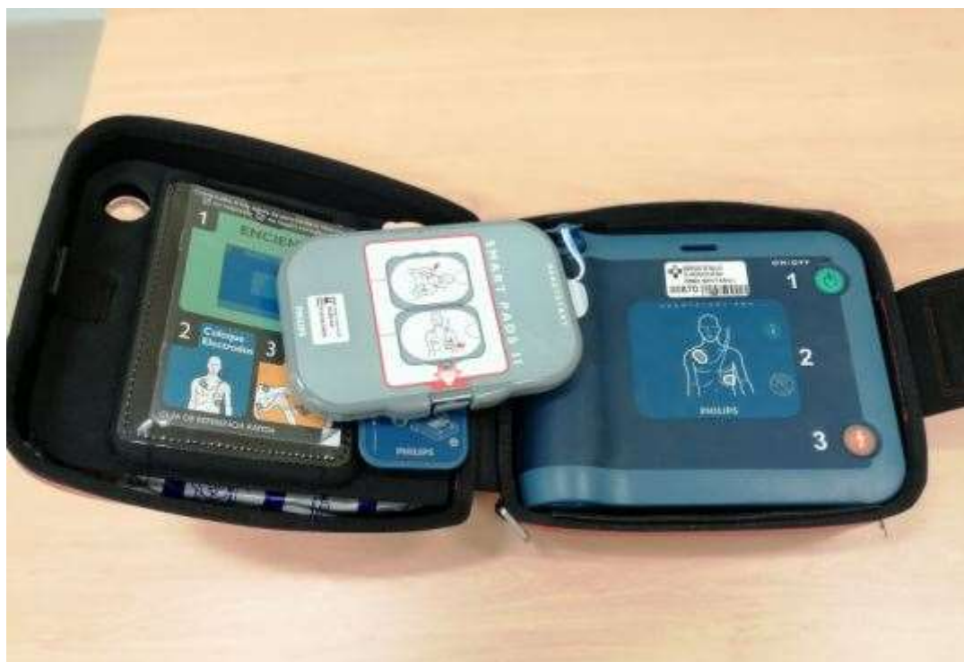
Imágenes VII y VIII: Desfibrilador externo semiautomático.