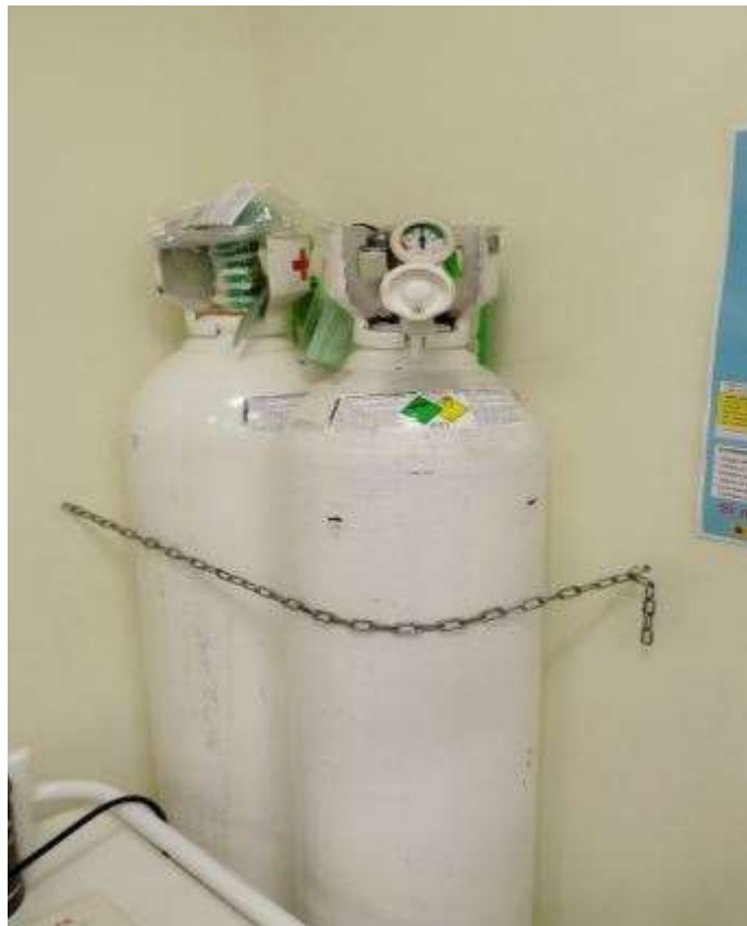
Imagen III: Bombonas de O2 con caudalímetro.