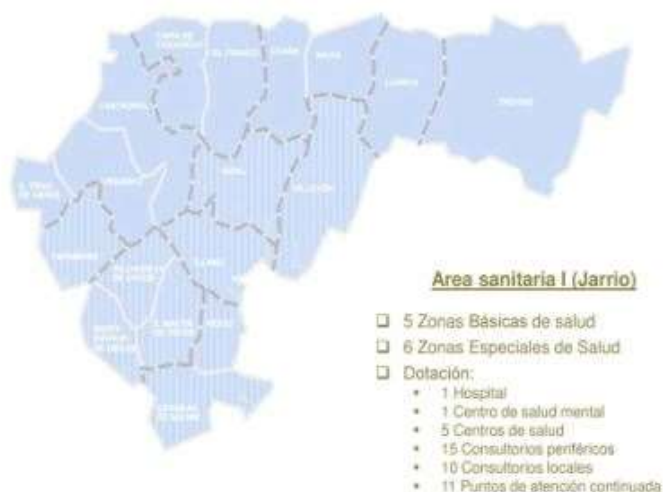
Imagen 3: Población y relación de zonas de salud por cada área sanitaria.