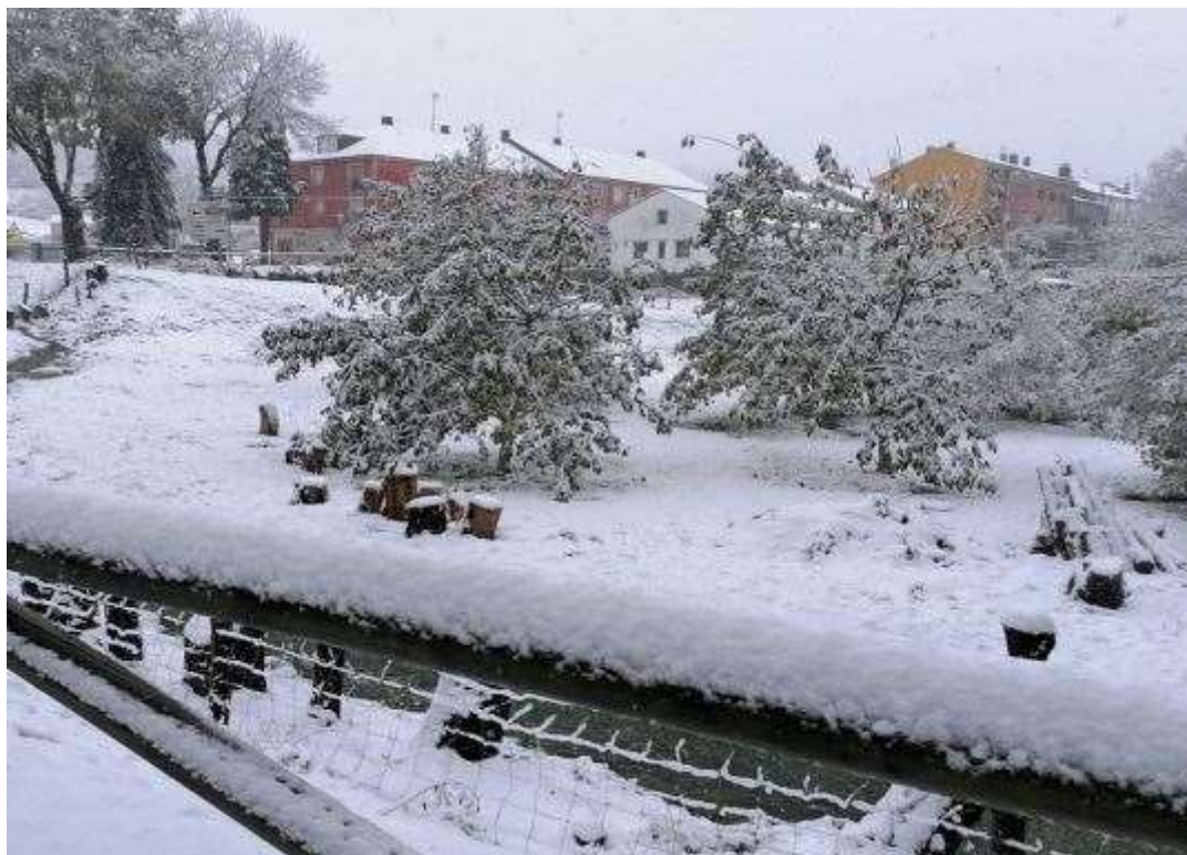
Imagen XV: Grandas de salime. Nevada Noviembre 2019.