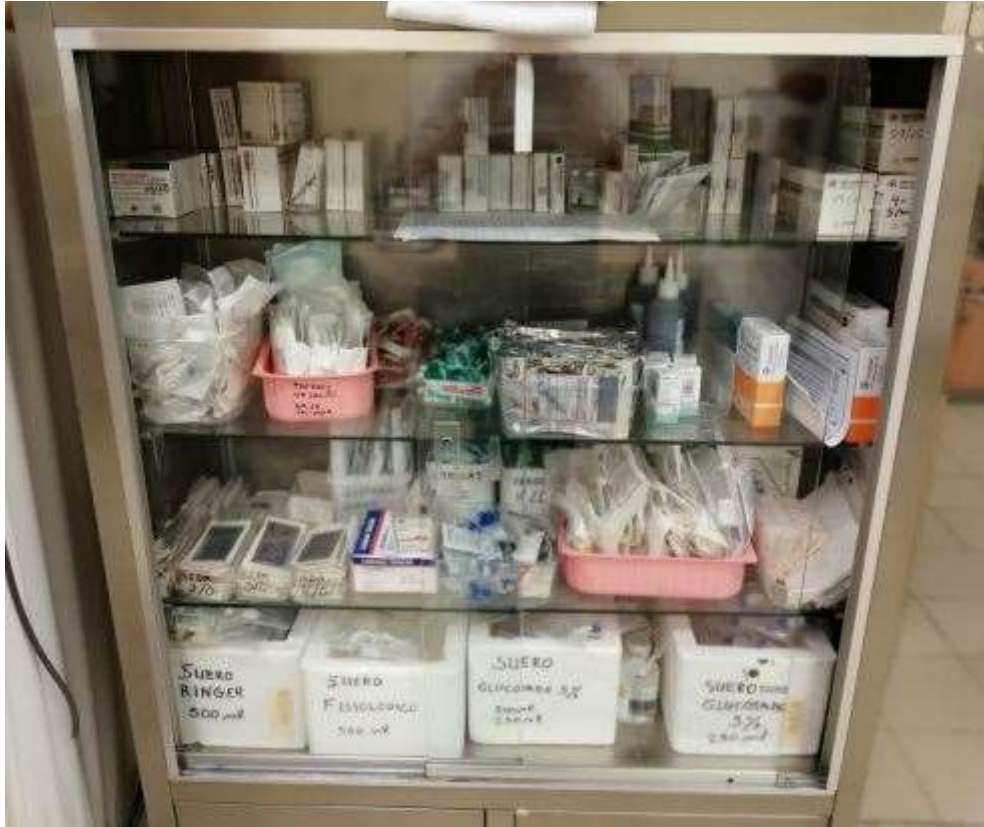
Imagen V: Vitrina de almacenamiento de sueros, stock de medicación, suturas y material de acceso venoso.