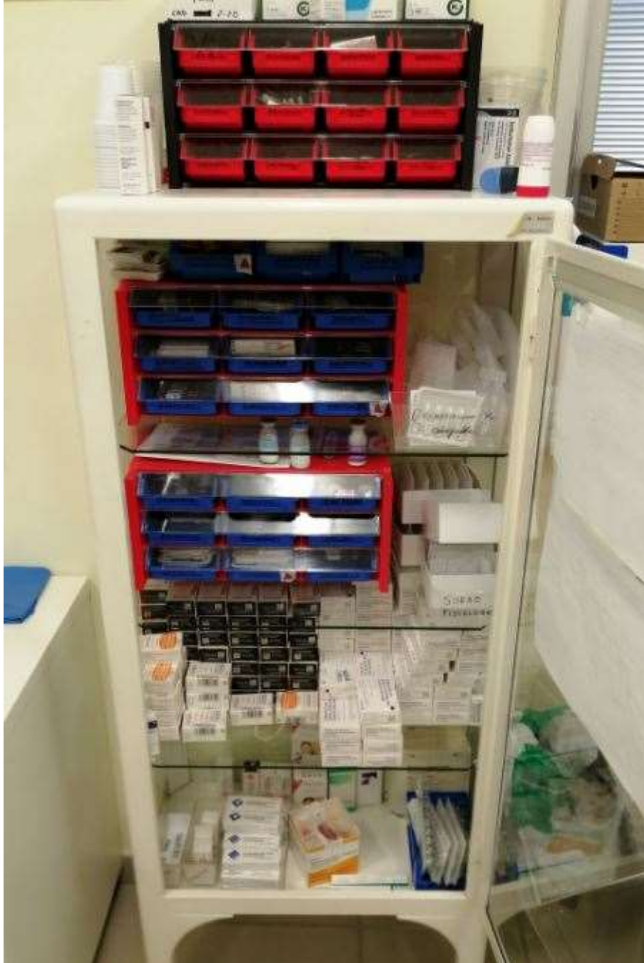
Imagen IV: Vitrina con medicación oral, intravenosa y oftálmica.