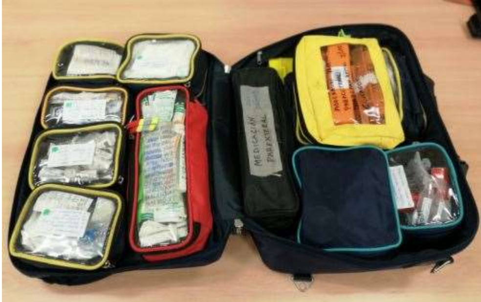
Imagen XI: Departamentos interiores del maletín azul de emergencias.