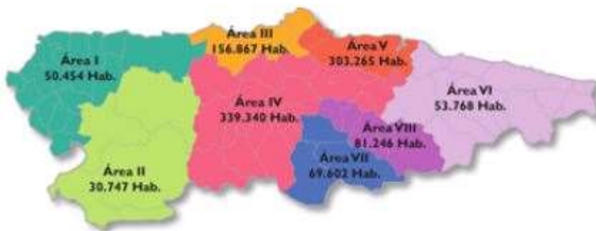
Imagen 1: Mapa sanitario del Principado de Asturias.