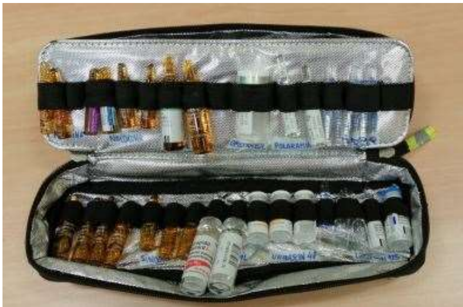
Imagen X: Estuche de transporte y organización de medicación IV. Incluido dentro del maletín de emergencias azul.