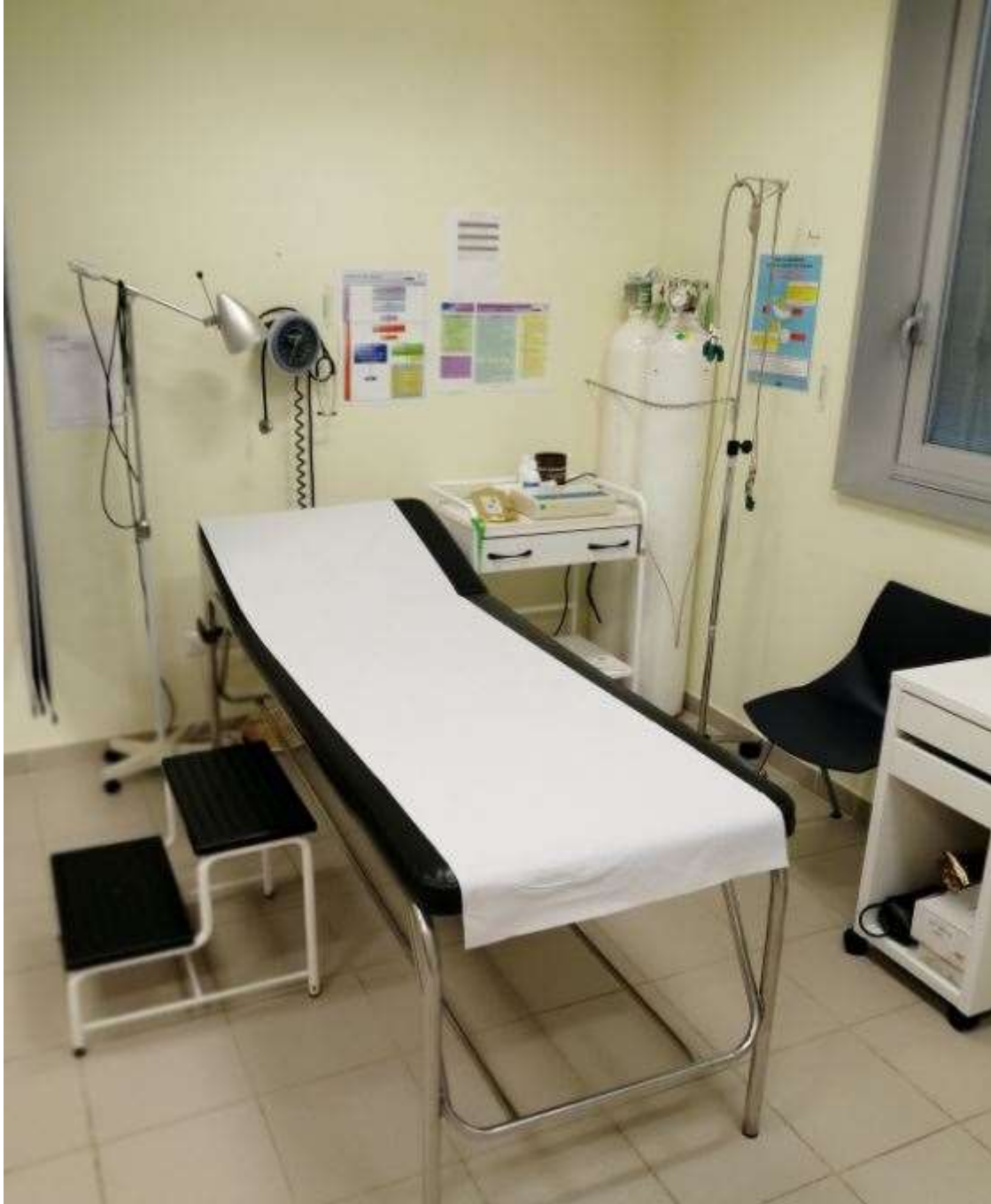
Imagen I: Camilla de sala polivalente para emergencias. Dispone de oxígeno, lámpara de iluminación y electrocardiograma en cabecera de la mesa sobre mueble auxiliar.