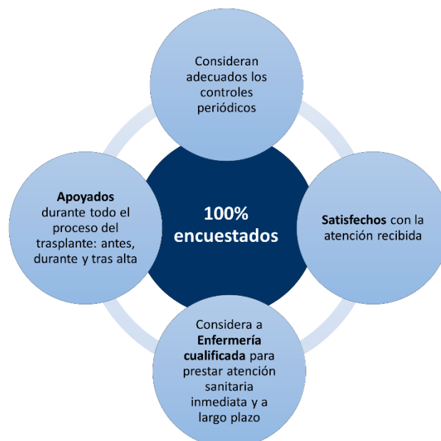
Figura 2. Percepción de los encuestados.