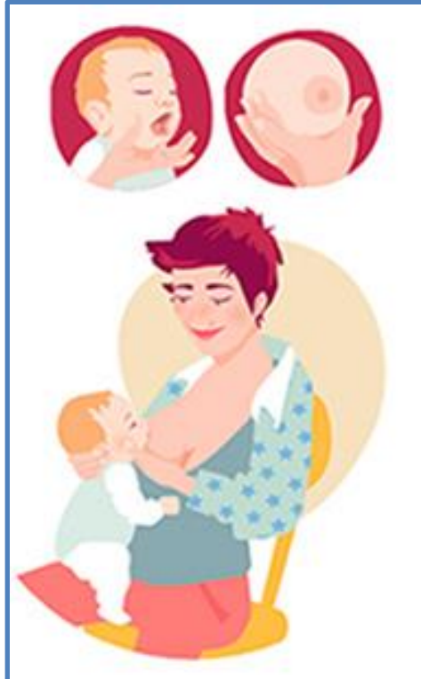
Figura 3. Postura de caballito o Posición de "Dancer".