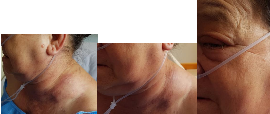
Figura 3: adenopatías duras, no móviles, adheridas a planos profundos en región cervical, además de edema palpebral