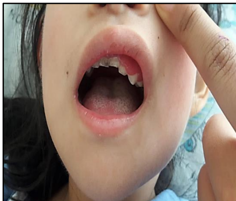
Figura 5. Gingivitis en encías superiores y lengua con placas blanquecinas.