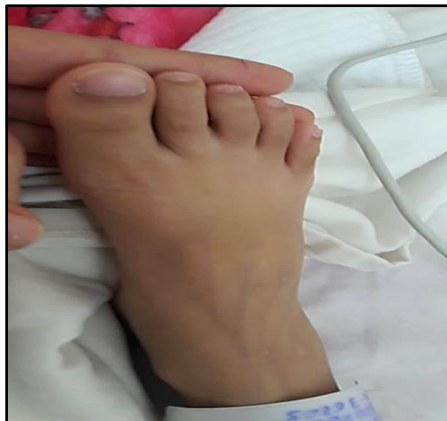
Figura 10. Acropaquia en hallux.