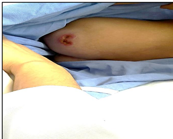
Figura 11. Lesión cutánea ulcerosa de bordes irregulares eritematosos con centro purulento en región glútea izquierda.