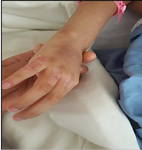
Figura 9. Lesiones cutáneas descamativas en mano derecha.