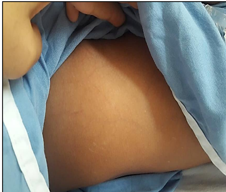
Figura 2. Piel fina, suave, aterciopelada con turgencia y elasticidad conservada.