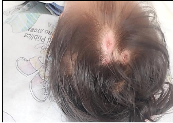
Figura 3. Se aprecia lesiones descamativas en cuero cabelludo de 2 cm de diámetro con bordes eritematosos.