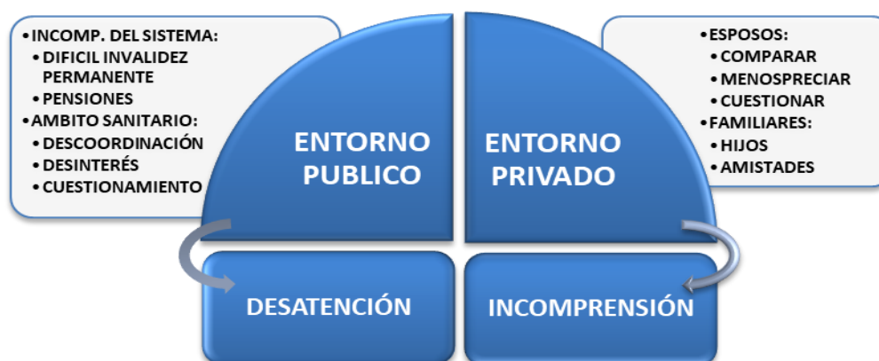
Figura Nº 2: Credibilidad